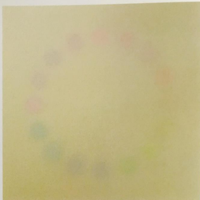
Sanmon WCC - yuhotanjyu + nupotanje, 2005 ワックス、油彩 各125.7 x 125.7 x 13.5 cm